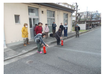
■ 団地内消防訓練の様子